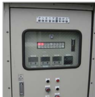
除害・脱臭燃焼設備の制御盤