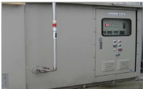
除害・脱臭燃焼設備の外観

◎下記の写真のガス設備以外に、御客様の処理ガス量、処理パターン、各種要望に沿った燃焼式除害・脱臭設備をご提供させていただきます。