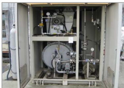
除害・脱臭燃焼設備