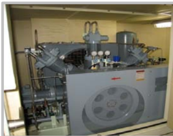
低圧・ガス圧縮ユニット