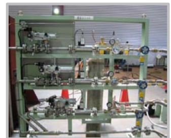
流量制御ユニット