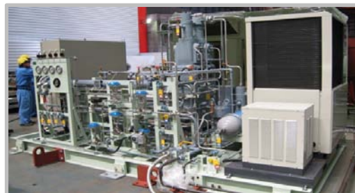
◎ガス循環流量・圧力制御ユニット