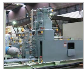
高圧・ガス圧縮ユニット

大陽日酸東関東株式会社は、高圧ガスの新技術のリーディング・トータルサプライヤーです。