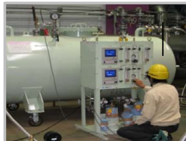
◎ガス分析制御ユニット