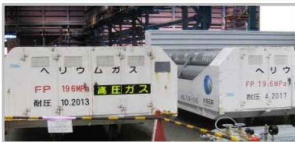
混合ガス原料ガス